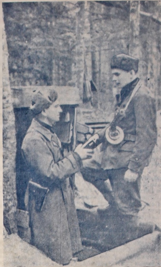
На здымку: Партизаны ў час баявых заняткаў.

Хлапчукі, Хлапчукі... І пажоўкляя фатаграфія Падае З мацярынскай рукі. Мама, даражэнькія, Мы ведаем вашы біяграфіі. Мы не з такіх, Каб не ведаць. Чуецца рэквіем? Яго радкі Поўны суму, Помсты, трагедыі. Ах, навошта глядзець у роспачы? Гэта праўда: Мёртвым не ўзняцца. Прыгадала яго ў салдацкім, Свайго мужа, А майго ж — бацьку. Мне ад позірку твайго горача. Я без бацькі спаткаў юнацтва. Кажаш, Я на яго падобны. Толькі вочы твае У мяне. Разглядаць нас не можаш Асобна. Яшчэ некалькі год міне. Зноў успомніш Сваю біяграфію. Зноў з твайёй мацярынскай рукі Выпадуць фатаграфіі. І ты будзеш шаптаць: — Хлапчукі, Хлапчукі. Ул. ДЗЮБА.