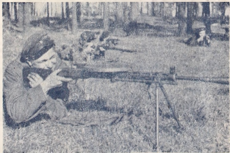
На здымку: Партизаны перад баявым заданнем.

сотні разбітых вагонаў танкаў, трупы салдат, гвалт і бегатня, паніка. «Вось вам гадзі! Смерць за смерць!»